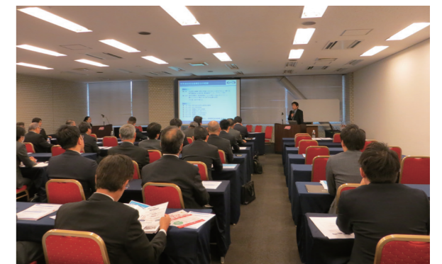
レジリエンス認証説明会の様子(2016年11月札幌で開催)