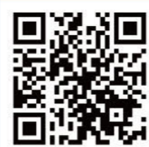
レジリエンス認証HP