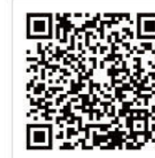
ジャパン・レジリエンス・アワード2025 (強靱化大賞)