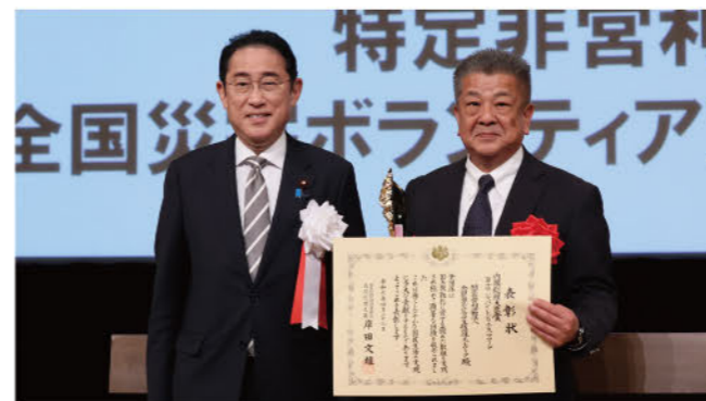
アワード受賞の様子(レジリエンス認証取得団体の多くが受賞しています)

レジリエンス認証説明会の開催 シンポジウム、ジャパン・レジリエンス・アワード等の開催 レジリエンス認証取得団体交流会の開催