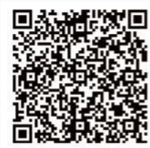
内閣官房国土強靱化推進室HP 「レジリエンスの認証」の紹介