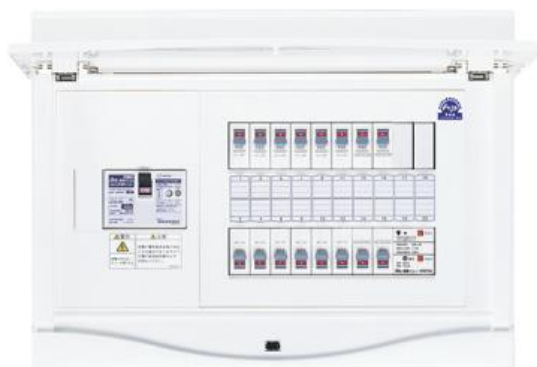
感震ブレーカーの画像

マンションは災害に強く、震災時の倒壊や火災時の延焼リスクは木造の戸建住宅と比較すると低いと言われていますが、一方で将来発生する可能性が高い大地震への対策が遅れていることも指摘されています。阪神・淡路大震災と東日本大震災で発生した火災のうち、電気に関連したものが半数以上を占め、その多くが通電火災*によるものです。